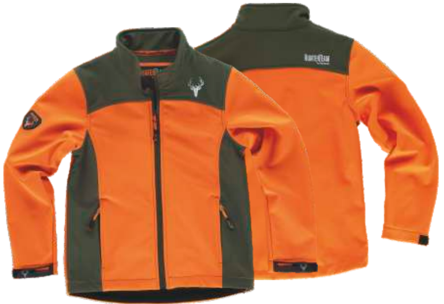
naranja a.v./verde caza

Tejido: 96% Poliéster 4% Elastano (300 g/m2)